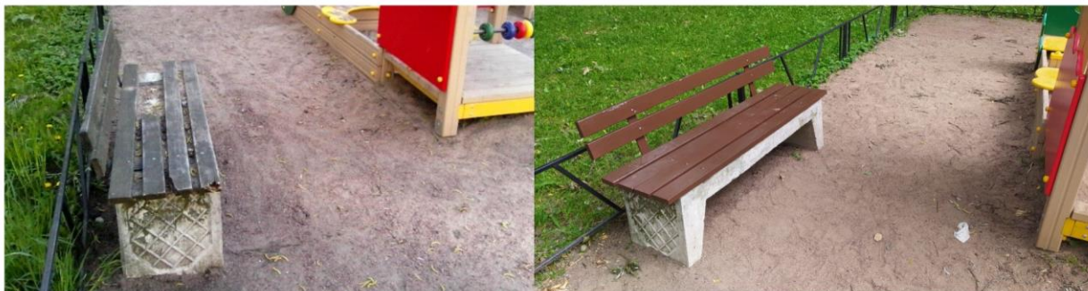
ремонт и покраска 5 скамеек