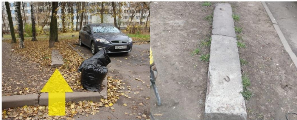
СОФИЙСКАЯ УЛ. 32