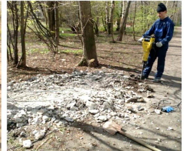
УЛ. БЕЛЫ КУНА 25