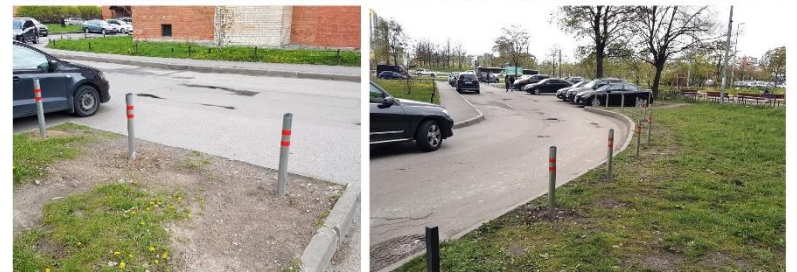
ПРОСПЕКТ СЛАВЫ 40/1