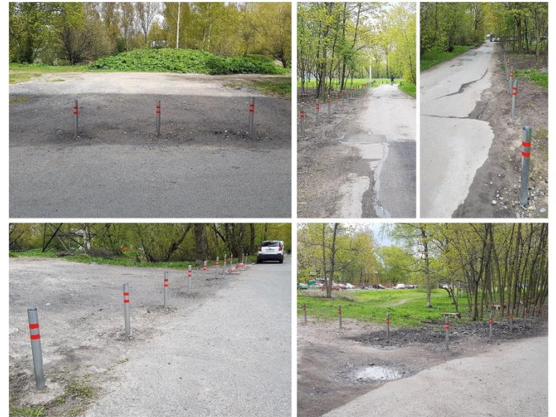
БЕЛЫ КУНА 27